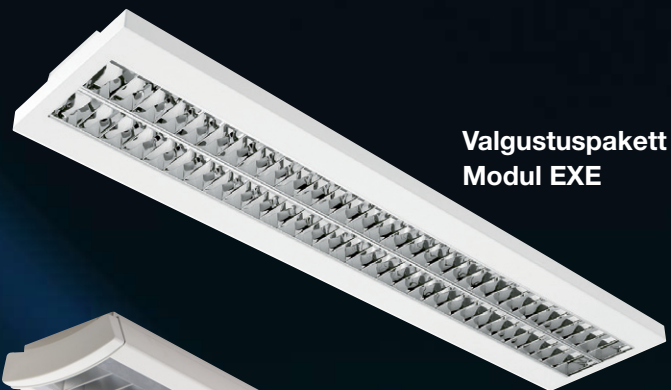
Valgustuspakett Modul EXE